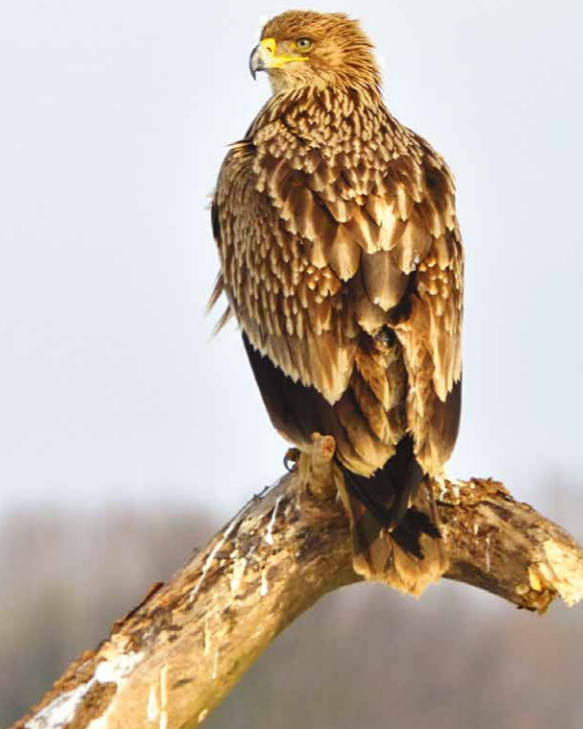
Orao krstaš ( Aquila heliaca ), József Gergely