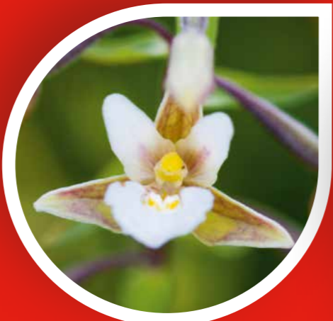
Barska kaluždarka ( Epipactis palustris ) Zavod za zaštitu prirode Srbije