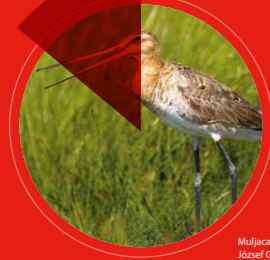
Muljaca ( Limosa limosa ) József Gergely