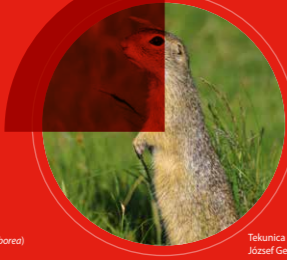
Tekunica ( Spermophilus citellus ) József Gergely