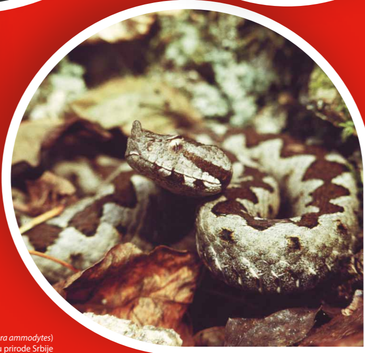
Poskok ( Vipera ammodytes ) Zavod za zaštitu prirode Srbije

Prema raspoloživim podacima, u Republici Srbiji je zvanično registrovano oko 44.200 taksona (vrsta i podvrsta). S obzirom na stepen istraženosti biodiverziteta, pretpostavlja se da je broj taksona mnogo veći i da se kreće oko 60.000. Do sada je opisano: