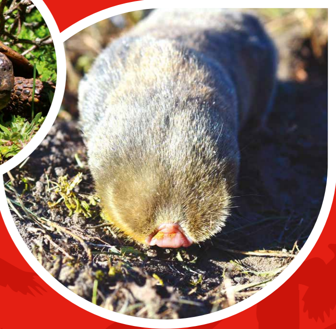
Slepo kuče ( Spalax leucodon ) József Gergely

U Srbiji su do sada objavljene dve Crvene knjige: