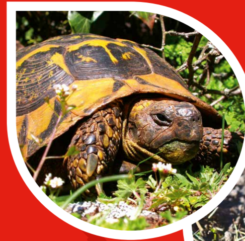
Šumska kornjača ( Testudo hermanni ) Zavod za zaštitu prirode Srbije